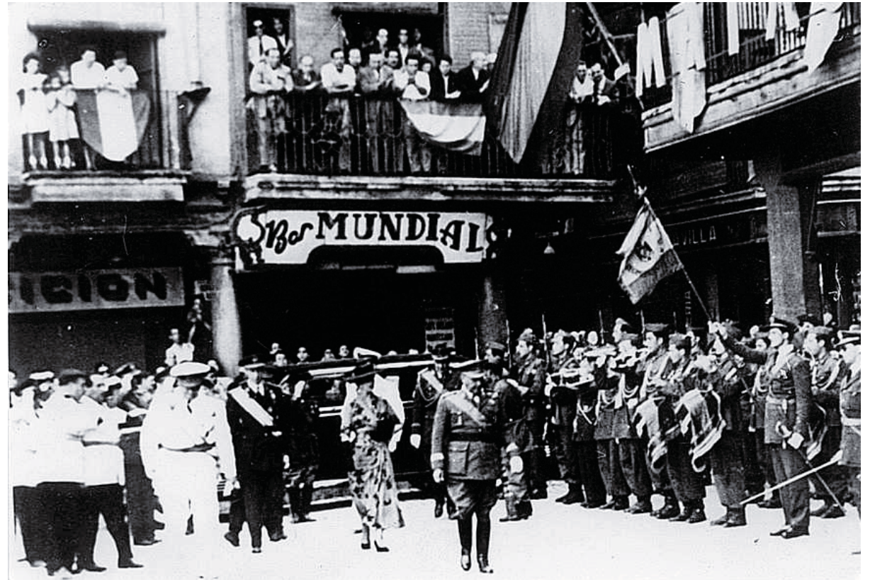
Image of Franco in Reus, Spain in 1949. Image is in the public domain .